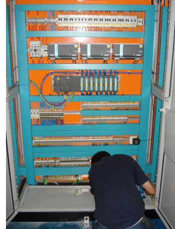
Figura 3 – Painel Controlador Simotion C230