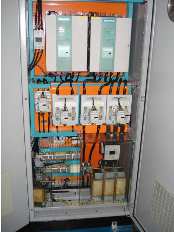
Figura 2 – Painel Desbobinadeira e Endireitadeira